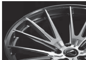
LEXUS 純正センターキャップ対応