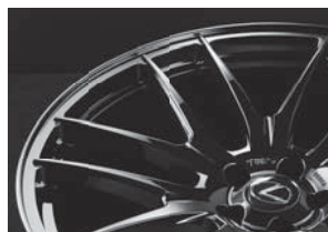
LEXUS 純正センターキャップ対応