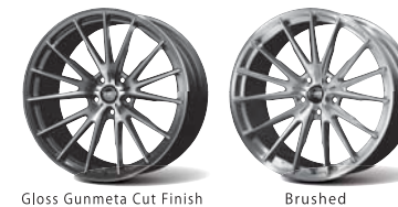
Gloss Gunmeta Cut Finish