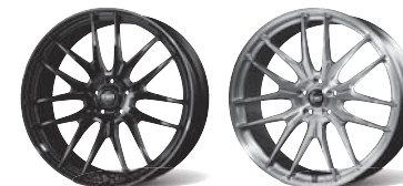
Gloss Black Flange Cut