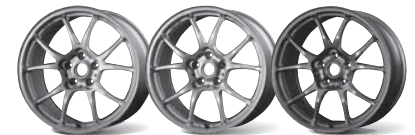
Flat Gold Gloss Silver Gloss Gunmeta