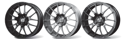
Flat Black Silver Pearl Alumite Flat Hyper Gunmeta