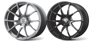
Gloss Silver Gloss Black